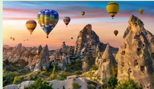
Imagen 10