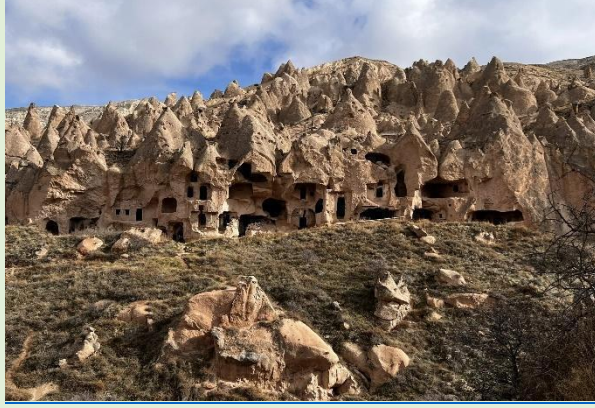
Kapadokya'da peri bacaları