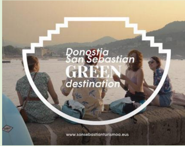
Donostia San Sebastian Yeşil Turizm Bölgesi