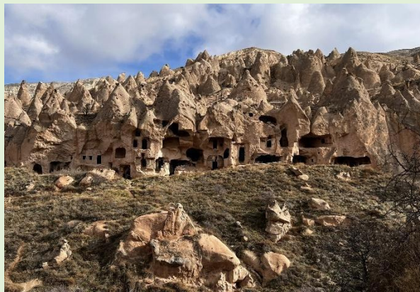
Figure 7 : https://www.alltrails.com/parks/turkey/nevsehir/goreme-national-park