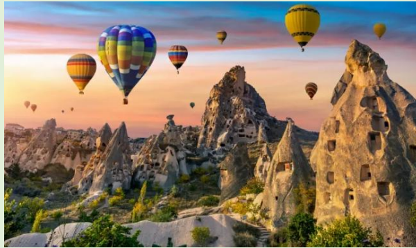
Figure 6 : https://www.destinations.com.tr/cappadocia-2024/