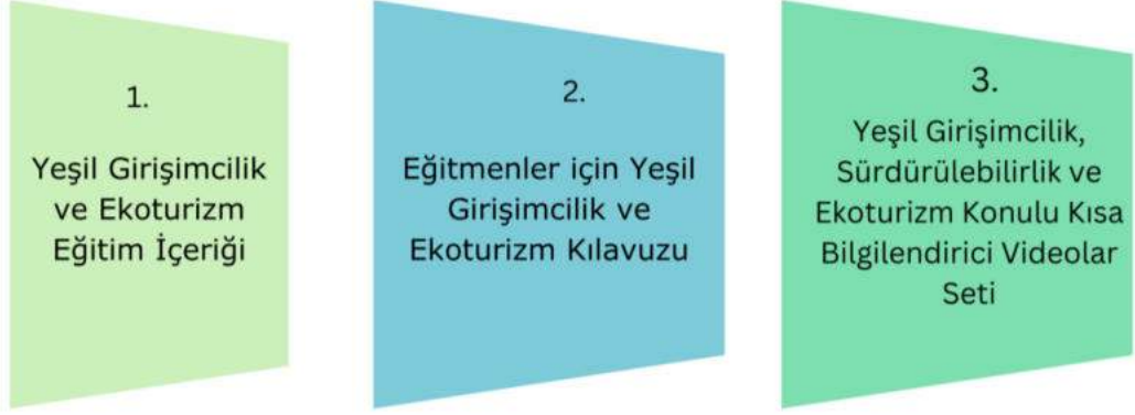
Görsel 1: Green Tour Proje Sonuçları