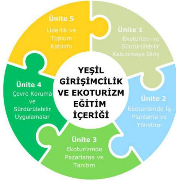
Görsel 5: Green Tour Eđitim Üniteleri

kazandırılmasını sađlayan, bütüncül yapıda tasarlanmış beş üniteden oluşmaktadır.