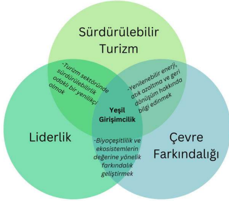
Görsel 3: Yeşil girişimciliğin üç ana unsuru

Green Tour Projesi, eğitim materyalleri geliştirerek ve farkındalığı artırmak için ekoturizm ve yeşil beceriler gibi temel kavramları teşvik ederek özellikle turizm sektörüne odaklanarak Yeşil Girişimcilik eğitimini geliştirmeyi amaçlamaktadır. Bu kılavuz, Ekoturizm ve Yeşil Girişimcilik alanlarında çalışan eğitimcileri desteklemek için tasarlanmıştır. Aşağıdaki bölümde, Green Tour Projesi'nin ortak ülkeleri olan Fransa, Türkiye, Portekiz, Yunanistan ve İspanya'dan Yeşil Girişimcilik eğitim uygulamalarına ilişkin örnekler, bu ülkelerin faaliyetleri, metodolojileri ve yaklaşımları sunulmaktadır.