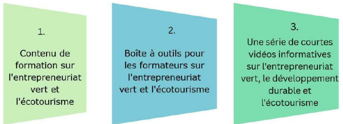
Figure 1 : Résultats du projet Green Tour