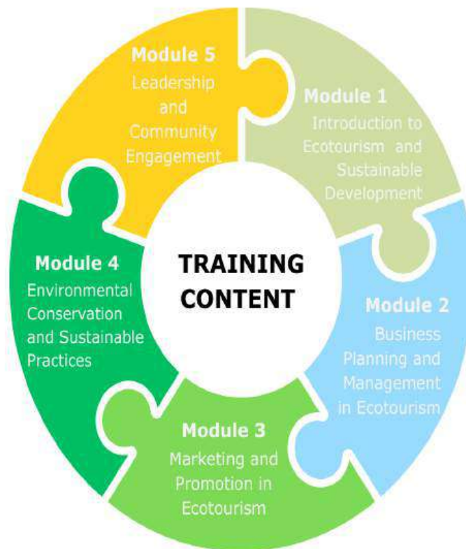
Figure 3 : Noms des modules du contenu de la formation Green Tour

Le « Contenu de formation sur l'entrepreneuriat vert et l'écotourisme » est structuré en cinq modules, composantes indissociables qui permettent d'acquérir progressivement des connaissances et des compétences en matière d'entrepreneuriat vert et d'écotourisme.