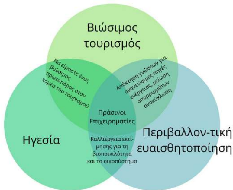
Εικόνα 3: Οι τρεις βασικοί πυλώνες της πράσινης επιχειρηματικότητας

Το έργο Green Tour στοχεύει στην ενίσχυση της κατάρτισης στον τομέα της πράσινης επιχειρηματικότητας, με ιδιαίτερη έμφαση στον τουριστικό τομέα, μέσω της ανάπτυξης εκπαιδευτικού υλικού και της προώθησης βασικών εννοιών, όπως ο οικοτουρισμός και οι πράσινες δεξιότητες, με σκοπό την ευαισθητοποίηση του κοινού. Ο παρών οδηγός έχει σχεδιαστεί για να υποστηρίξει τους εκπαιδευτές που εργάζονται στους τομείς του οικοτουρισμού και της πράσινης επιχειρηματικότητας. Στην επόμενη ενότητα παρουσιάζονται παραδείγματα πρακτικών κατάρτισης στην πράσινη επιχειρηματικότητα από τις χώρες-εταίρους του έργου – τη Γαλλία, την Τουρκία, την Πορτογαλία, την Ελλάδα και την Ισπανία – με τις δραστηριότητες, τις μεθοδολογίες και τις προσεγγίσεις τους.