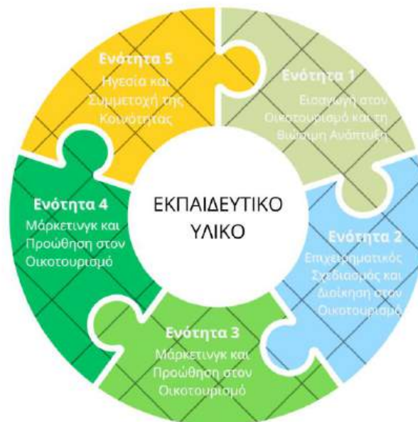
Εικόνα 4: Τίτλοι ενοτήτων του εκπαιδευτικού υλικού Green Tour

Το «Εκπαιδευτικό Υλικό για την Πράσινη Επιχειρηματικότητα και τον Οικοτουρισμό» είναι δομημένο σε πέντε ενότητες, που αναπτύσσουν σταδιακά τις γνώσεις και τις δεξιότητες στην πράσινη επιχειρηματικότητα και τον οικοτουρισμό.